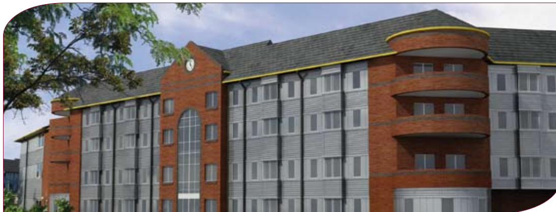
Radharc ar an tsaoráid taighde cliniciúil ón taobh amuigh