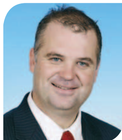
An Dr. Tony Holohan (chuig mí an Mheithimh 2010) Príomhoifigeach Leighis An Roinn Sláinte agus Leanaí